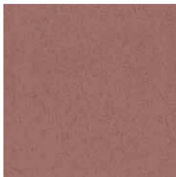
904 Legno di cedro / Cedar wood