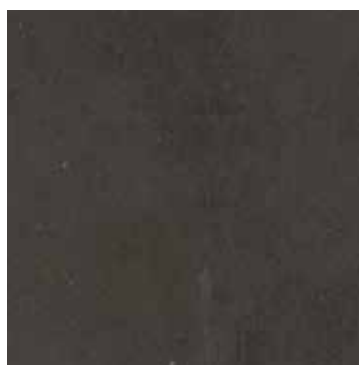
406 Marrone scuro / Turkish coffee