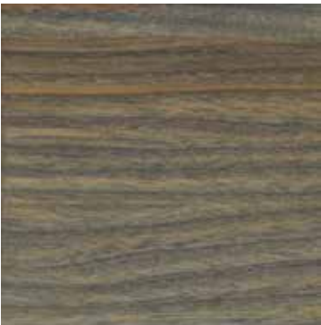
FRASSINO CONTRATTAMENTO ACETICO ACETIC-FINISHED ASH

Discarded eco-friendly solid ash, walnut-stained or bleached with open pore finish. By this process the wood pores are deliberately left open, thereby allowing the veneer to retain its natural appearance.