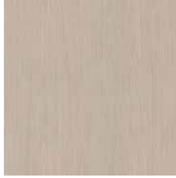
FRASSINO SBIANCATO BLEACHED ASHWOOD

Gio chair, Selima chair, Selima tv cabinet, Selima console, Kaala coffee table, Selima bedside table, Astra bed, Astra lamp