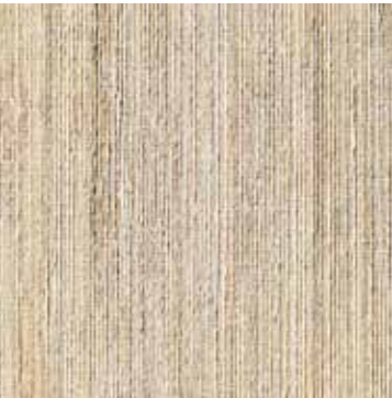
FIBRA DI CANAPA NEPALESE HEMP FIBER BEIGE Pablo Lamp, Oscar lamp, Kaala lamp

100% banana leaves on non woven backing. Avoid any contact with water, clean with a dry cloth. Color can vary from each production.