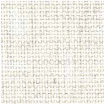
Gog Avorio / Ivory