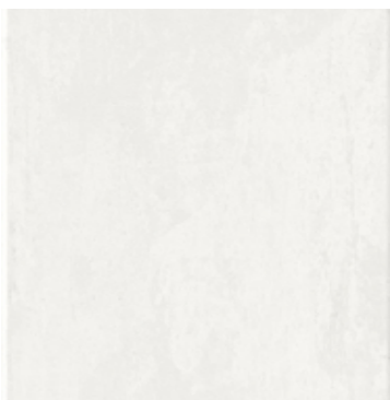
CERAMICA LUCIDA DI FAENZA BIANCA SMALTATA GLOSSY WHITE FAENZA CERAMIC Cesar Console

HANDMADE CERAMICS FROM VIETRI: the clay is worked on a lathe, where design and shape are realized, and it follows a first firing stage. At this point, it comes a long process of glazing and handmade decoration. The final product need to be undisturbed and fired in special furnaces.