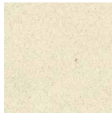
100 Avorio / Egg shell