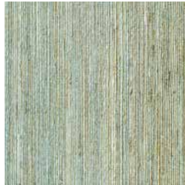
FIBRA DI CANAPA NEPALESE HEMP FIBER TURCHESE /TURQUOISE Selima tv cabinet, Kaala lamp

89% canapa 6% nylon 5% PL su supporto non tessuto Evitare il contatto con l'acqua, pulire con un panno asciutto.