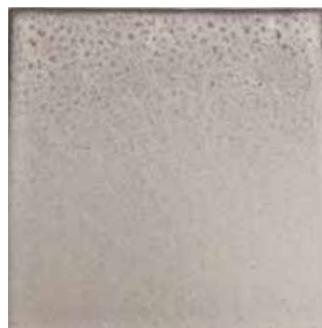
CERAMICA DI FAENZA OPA-CA BIANCO SPORCO MATT FAENZA OFF - WHITE CERAMIC Pablo lamp

CERAMICHE ARTIGIANALI DI FAENZA: impasto ceramico realizzato artigianalmente con diverse composizioni e lavorazioni a seconda dell'effetto ricercato. Il tutto viene cotto in forno a 960° gradi.