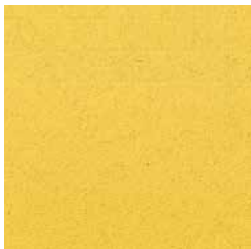
504 Limone / Lemon