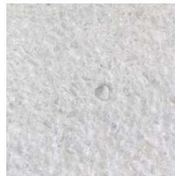
PIETRA RICOSTITUITA A GRANA FINE - COL. GRIGIO cod. 115

RECONSTITUTED FINE GRAINED STONE - COL. GREY cod. 115