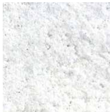
PIETRA RICOSTITUITA A GRANA FINE - COL. BIANCO cod. 78

RECONSTITUTED FINE GRAINED STONE - COL. WHITE cod. 78