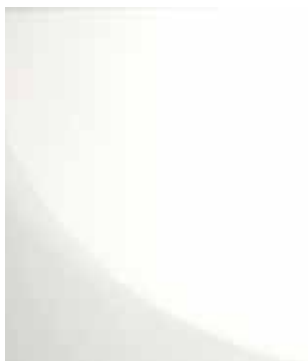
CERAMICA DI VIETRI SMALTATA GLOSSY CERAMIC FROM VIETRI COL. BIANCO /WHITE Kaala lamp, Kaala coffee table