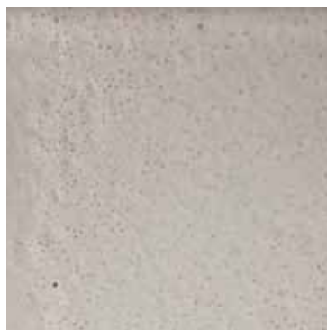
CERAMICA DI FAENZA OPA-CA BIANCA OTTICA MATT FAENZA OPTICAL WHITE CERAMIC Cesar Console, Pablo lamp, Oscar lamp