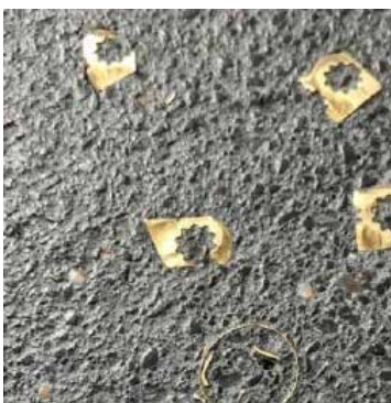
CARBONE NATURALE RICOSTITUITO CON TRUCIOLI DI OTTONE DA RECUPERO

NATURAL CARBON RECONSTITUTED WITH RECYCLED BRASS SHAVINGS