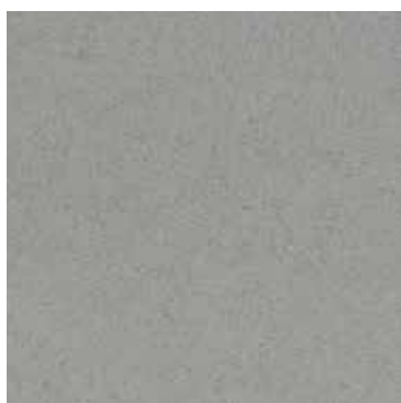
610 Grigio Chiaro / Light gray