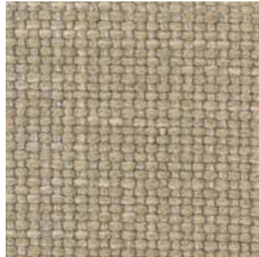
400 Corda / Rope