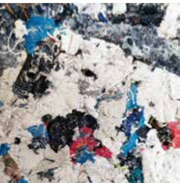
TESSUTO PRESSATO E RESINA PRESSED FABRIC AND RESIN Cesar console

89% hemp 6% nylon 5% PL on non woven backing Avoid any contact with water, clean with a dry cloth.