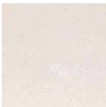
PIETRA VICENTINA LEVIGATA COL. AVORIO