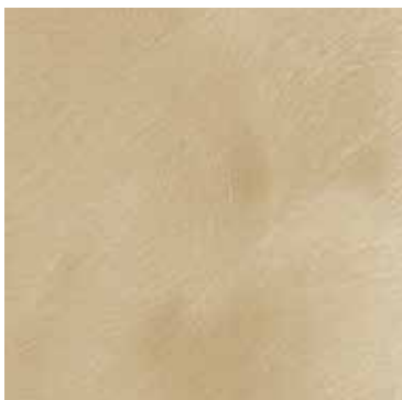
CHAMPAGNE A SATINATURA ORBITALE CHAMPAGNE ORBITAL SATIN FINISH Hyperbol stool, Hyperbol coffee table 80, Hyperbol coffee table 32, Egg table, Lina cabinet, Astra bed, Astra lamp, Selima bedside table