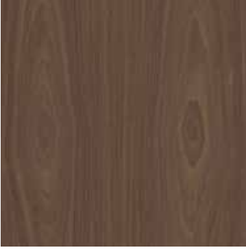
FRASSINO TINTO NOCE WALNUT STAINED ASH

Gio chair, Selima chair, Selima tv cabinet, Selima console, Kaala coffee table, Selima bedside table, Astra bed, Astra lamp