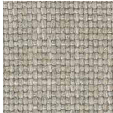
406 Lino / Linen