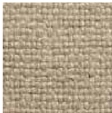
02 Sabbia / Sand