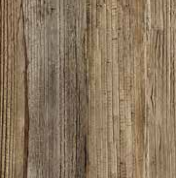
FOGLIA DI BANANO BANANO LEAF Hyperbol coffee table

Rivestimento composto al 100% da foglie di banana applicate su supporto non tessuto. Evitare il contatto con l'acqua, pulire con un panno asciutto. Il colore può variare a seconda della produzione.