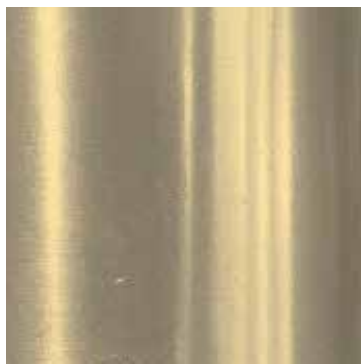
CHAMPAGNE LUCIDO POLISHED CHAMPAGNE Selima chair, Selima tv cabinet