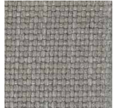
20 Grigio / Grey