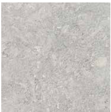
PIETRA VICENTINA SABBIATA COL. GRIGIO CHIARO

Hyperbol lamp, Hyperbol coffee table Ø80