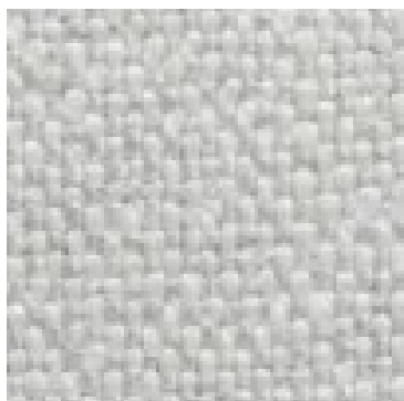
01 Bianco / White