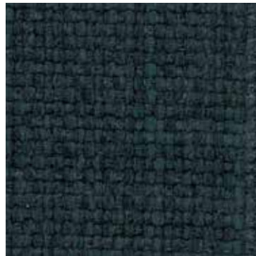
807 Ottanio / Teal