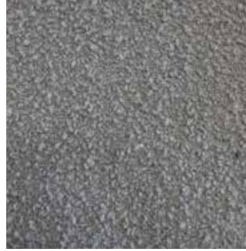
04 Perla / Pearl