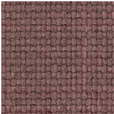
902 Rosa antico / Antique pink