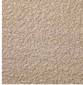
03 Lino / Linen