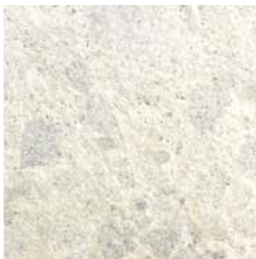
PIETRA RICOSTITUITA A GRANA GROSSA - COL. AVORIO CON GRANIGLIA GRIGIA cod. 305

RECONSTITUTED COARSE- GRAINED STONE - COL. IVORY WITH LARGE GREY GRIT STONES cod. 305