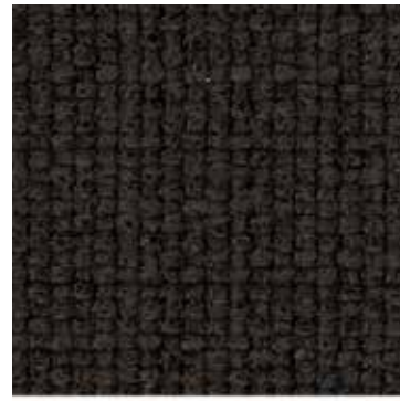
405 Moro / Dark Brown