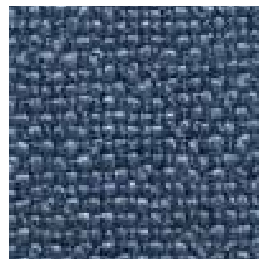
70/ 18 Blue