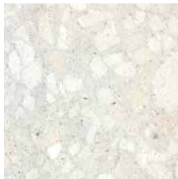
PIETRA RICOSTITUITA A GRANA GROSSA - COL. AVORIO CON GRANIGLIA BIANCA cod. 204

RECONSTITUTED COARSE -GRAINED STONE - COL. IVORY WITH LARGE WHITE GRIT STONES cod. 204