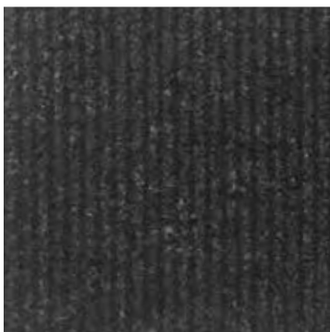
GRANITO ANTICO NERO TEXTURE RIGATA