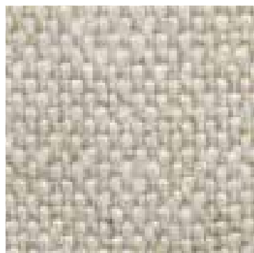
01 / 1 Beige